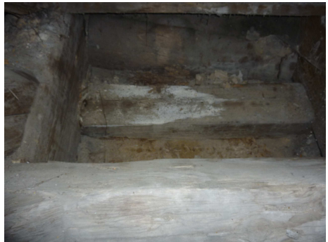
Schadensbilder aus der Niedercunnersdorfer Kirche