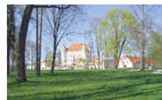
Schloss Schildau

Künstler machten die Landschaft am Fuße des Riesengebirges schon vor 1800 bekannt. Und als der preußische Adel kam, gab es kein Zögern mehr, es wurde schick, dort hin zu reisen. Die romantischen Maler haben dieses von der Natur privilegierte