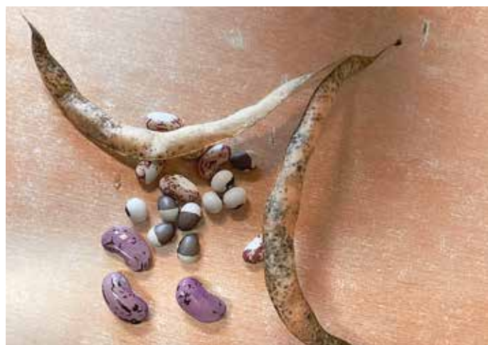
Bohnen, Foto: Romy Reichelt

Diese wunderschönen Namen gehören zu wunderschönen Bohnen, die wir Ende des Jahres noch von ihren eingetrockneten Hüllen befreien konnten. Sie sahen ganz unterschiedlich aus und fühlten sich wunderbar glatt an. Wir haben sie genau betrachtet und anschließend sortiert. Einige landeten in Gläsern mit etwas Watte und Wasser. Wir haben beobachtet, wie lange es dauert bis sich kleine grüne Spitzen aus den festen Bohnen drückten und neue Pflanzen entstanden. Ein spannendes Experiment. Auch wenn die Bohne wohl oft Grundlage für so manchen geringschätzigen Ausspruch sein mag („Das interessiert mich nicht die Bohne“), wir haben gestaunt über die vielen kleinen ganz unterschiedlichen Kunstwerke!