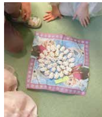
Schmätzchen