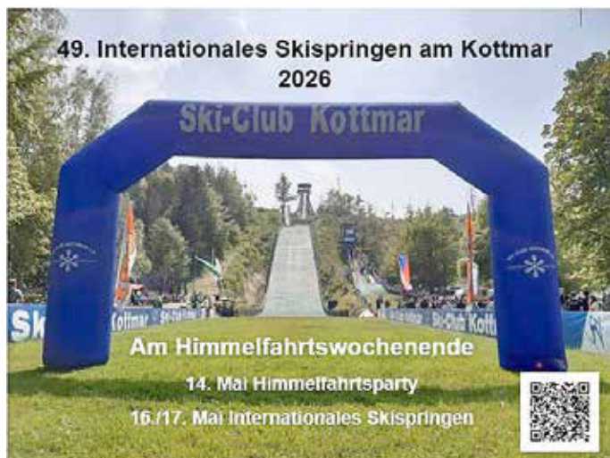
Internationales Skispringen - Bald ist es wieder so weit