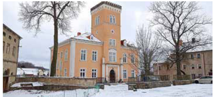
Denkmalgerecht aufgearbeitete Fenster halten nun verlässlich die Wärme im Haus.

Parallel zu den Renovierungsarbeiten wurden Kulturveranstaltungen geplant und durchgeführt: Von Konzerten über Lesungen und Ausstellungen gibt es inzwischen regelmäßige Angebote, die auch von Gästen aus den umliegenden Gemeinden gerne besucht werden.