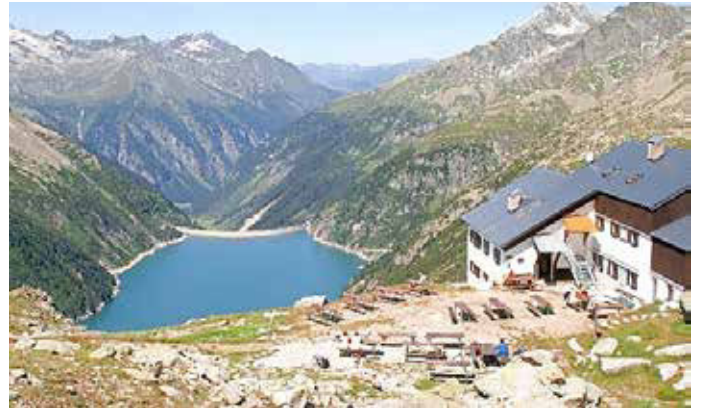
Plauener Hütte und Speicher Zillergründl, Foto: Dr. Peter Hennig

In diesem Lichtbildervortrag wird das schöne Zillertal mit seinen liebenswerten Ortschaften vorgestellt. Aber auch die romantischen Stauseen, umgeben von hohen Bergen, werden gezeigt. Bei einigen Wanderungen begeben wir uns zu Berghütten, die meist in größerer Höhe liegen, und weiter zu einigen Berggipfeln. Dabei können wir die Artenvielfalt der Bergflora bewundern. Auch dem Sommerskigebiet in Hinter-tux statten wir einen Besuch ab.