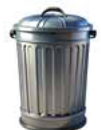
Grafik: KI generiert