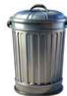
Grafik: KI generiert