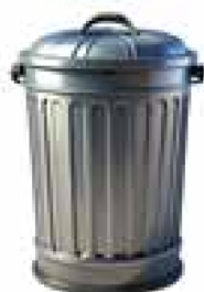
Grafik: KI generiert