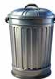
Grafik: KI generiert