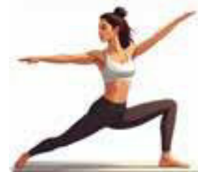
Grafik: KI generiert

Achtung - unser Kindersport ab 3 Jahren bis zum Schuleintritt findet wie gewohnt am Freitag von 16:30 bis 17:30 Uhr in der Sporthalle „Am Kottmar“ statt.