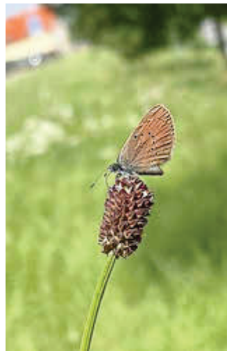
Der Dunkle Wiesenknopfameisenbläuling am Großen Wiesenknopf in Görlitz Weinhübel am 24.07.2025

Gemeinsam mit der Stadtverwaltung Görlitz, den Straßenmeistereien des Landkreises Görlitz und der unteren Naturschutzbehörde wurde man sich schnell einig. Während der Flugzeit des seltenen und gefährdeten Wiesenknopfameisenbläulings zwischen Juni und Mitte September wird der Große Wiesenknopf (Wirtspflanze des Falters) im straßenbegleitenden Grün belassen. Diese Maßnahme ist von großer Bedeutung, um den Lebensraum dieser gefährdeten Art zu sichern und die Biodiversität in unserer Region zu fördern.